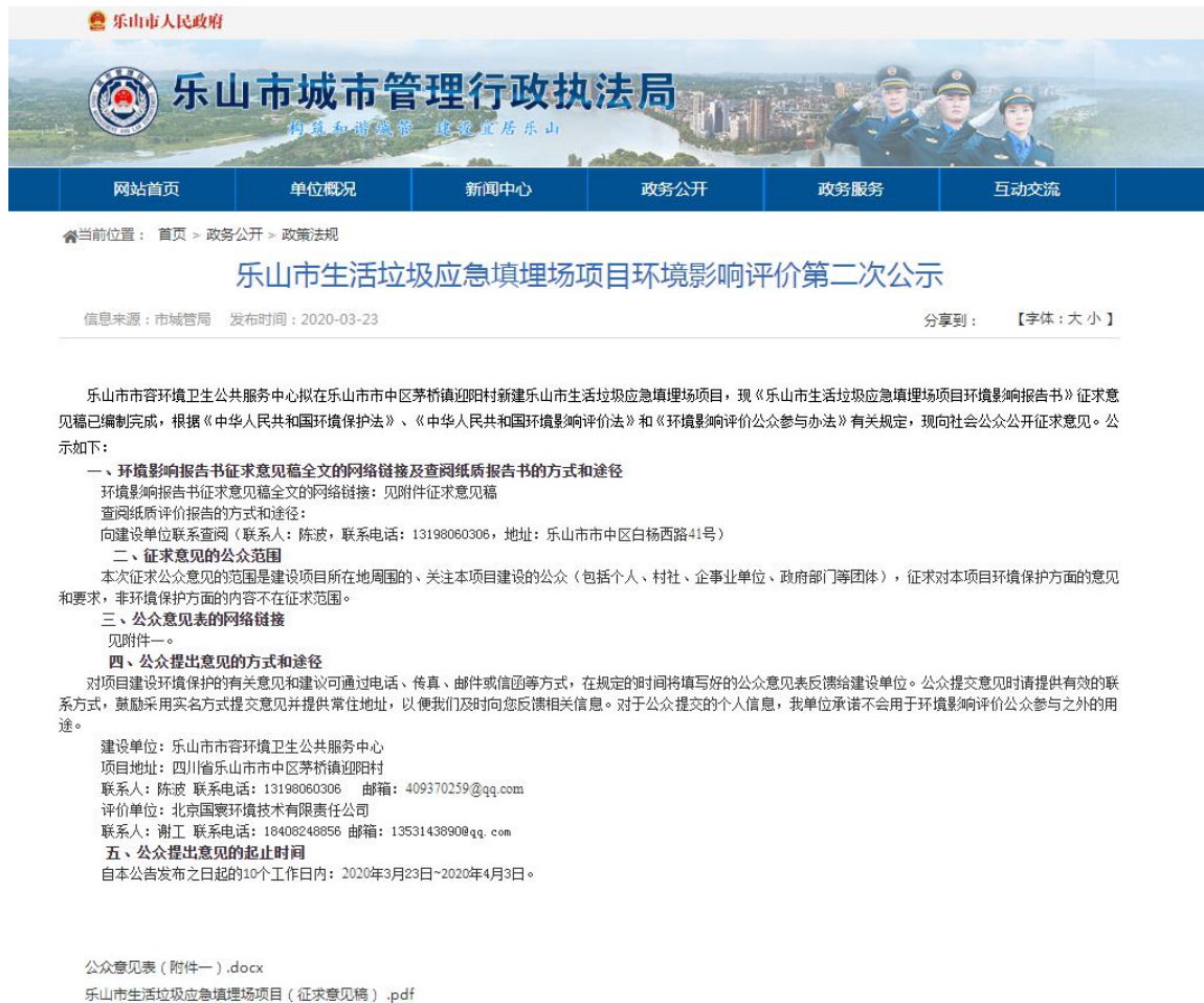
图 2 征求意见稿公示截图