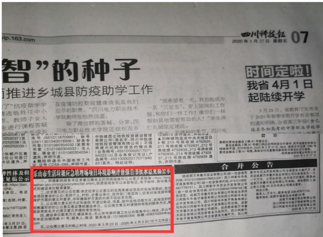
图3 四川科技报公示照片